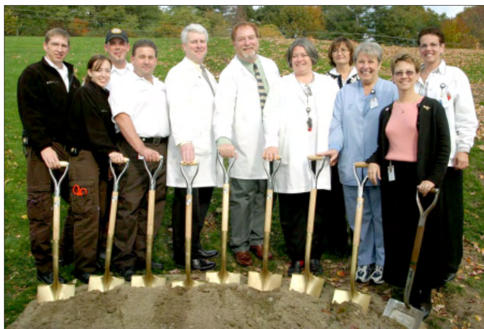
Members of LGH's emergency team at the groundbreaking.