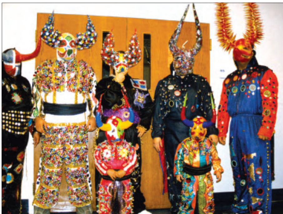
Los Cajuelos, típicos de la República Dominicana.