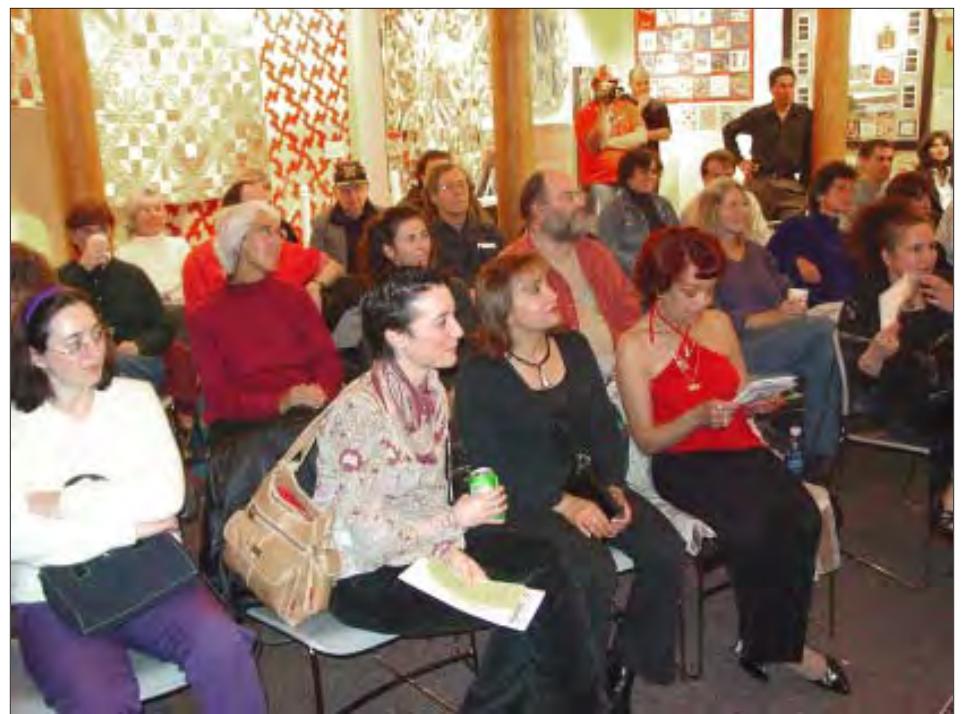
Parte del público asistente.

A pesar de que la mayoría de la audiencia no entendía español, demostró disfrutar a plenitud del ritmo contagioso de la música jíbara como el aguinaldo y el seis, emanado del cuatro puertorriqueño.