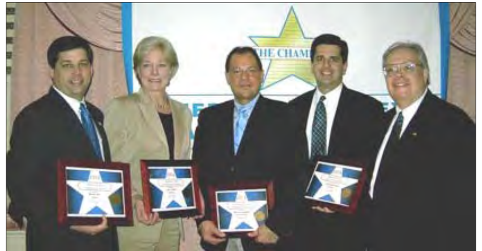
The Government Affairs Committee recognized the assistance of the many legislators assisting in the Chamber's educational forums. Among them are Senator Bruce Tarr, Senator Sue Tucker, Senate President Robert Travaglini, Senator Steven Baddour and Joe Bevilacqua, president of the Merrimack Valley Chamber of Commerce.