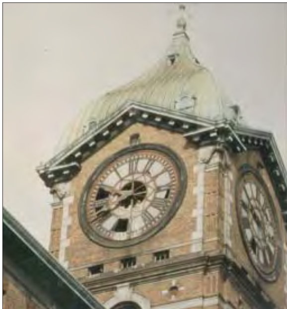
Ayer Mill Clock - before restoration.