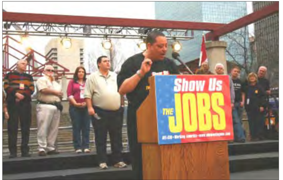
Demostraciones similares a esta tuvieron lugar por 18 ciudades de los Estados Unidos.

280 Haverhill St., Lawrence, MA - (978) 685-5366