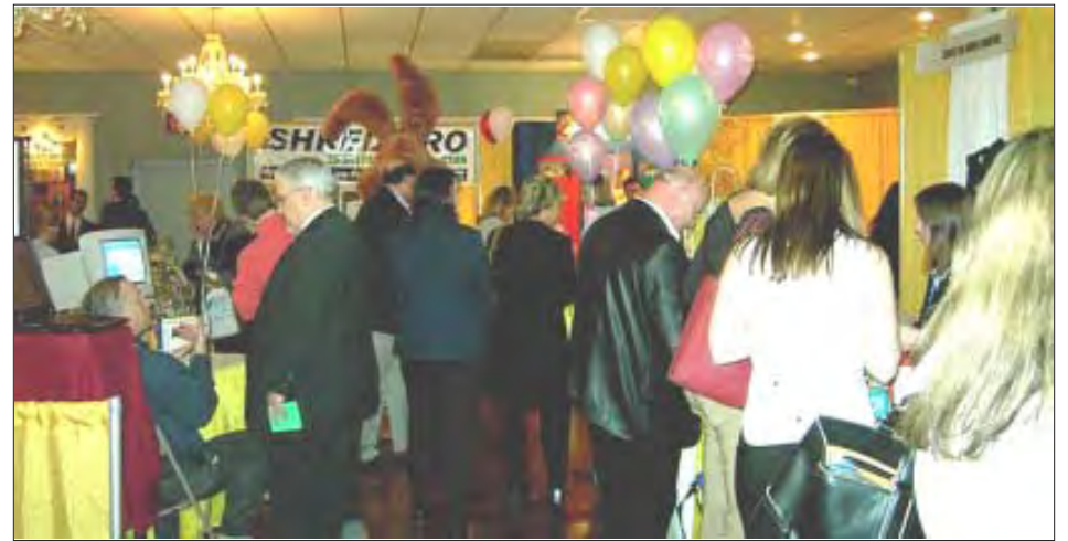
Partial view of the public in attendance to this year's Spring Business Expo sponsored by the Merrimack Valley Chamber of Commerce held at Pat's Function Hall in Haverhill.