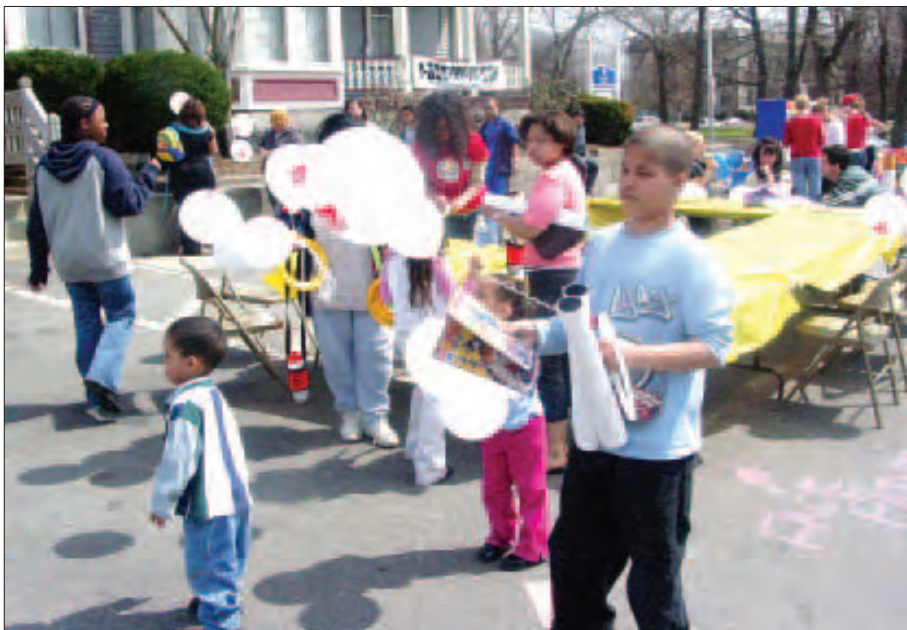
Otras vistas de voluntarios y público en general que asistieron a la feria.