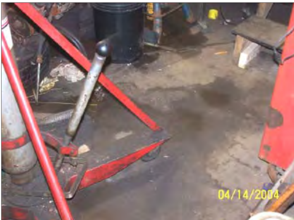
The wet floor shows the conditions under which employees have to work each time it rains.