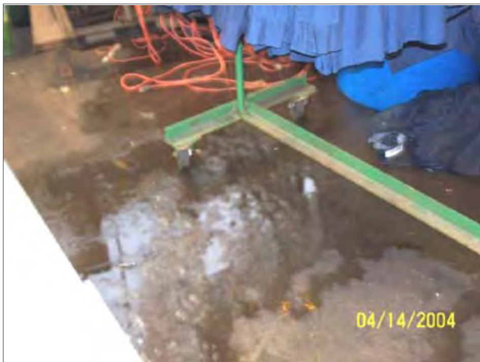
Another aspect of the wet floor at the Municipal Garage as a result of the rain coming through the roof.