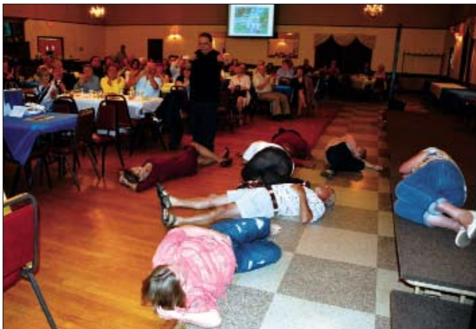
Y para colmo, al final los puso a dormir a todos... ¡en el suelo!