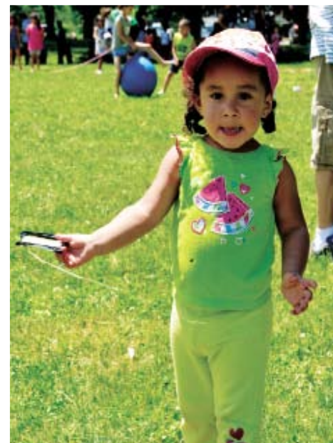
¡Perdí mi cometa! / I lost my kite!