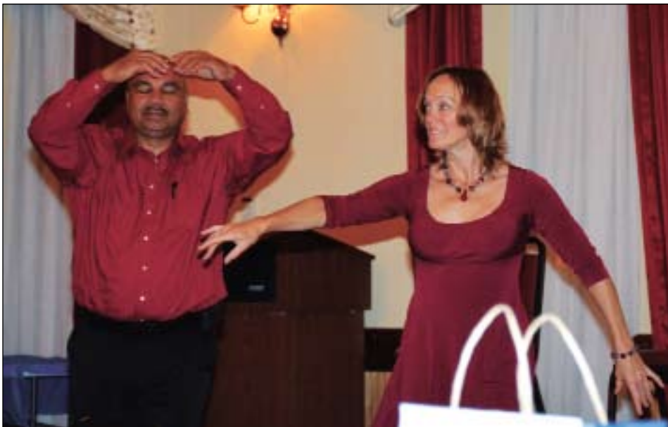
El bombero de Lawrence y miembro fundador de Heal Lawrence dando muestras de ser un gran bailarín de ballet, conjuntamente con una bailarina también hipnotizada.