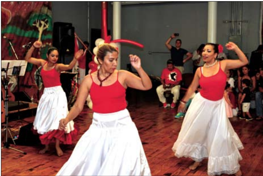
Grupo de danzas peruana.