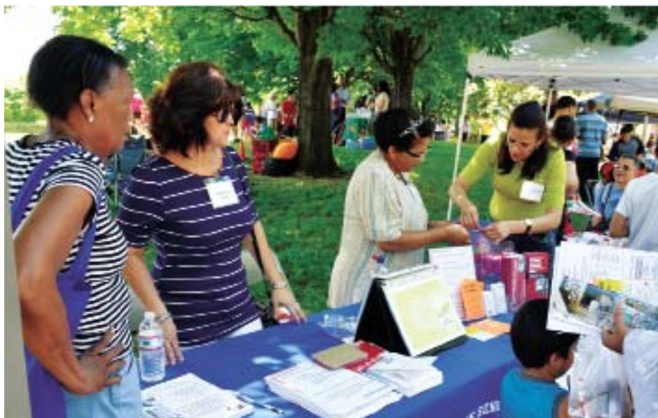
Las damas voluntarias del Senior Center siempre diciendo ¡presente!

Pemberton Park was filled with families with children who came to enjoy the activities offered at the Salsa Festival on Saturday, June 7, with plenty of food, music, games, Zumba lessons, trolley rides throughout the city and more.