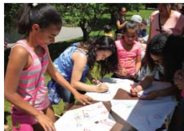
Antes de hacer la cometa hay que decorarla. / Before making the kite you have to decorate it.