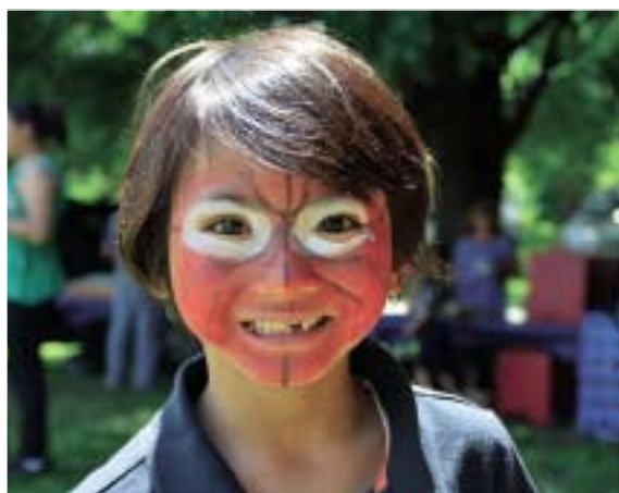
¿Sabes quien soy yo? / Can you tell who I am?