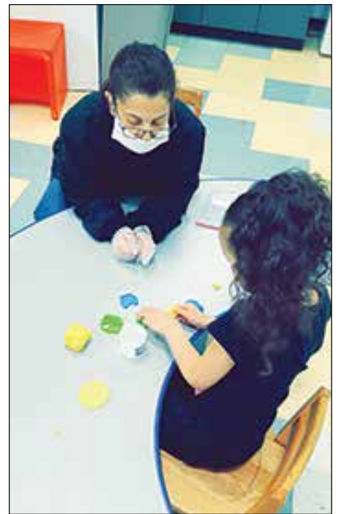
A teacher works with a student in GLCAC's emergency day care center.

Para hacer una reserva para la guardería infantil de emergencia, llame al 978-681-4959.