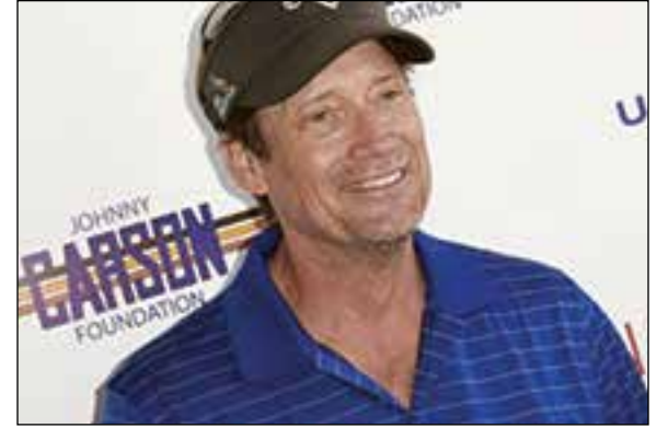
Kevin Sorbo

Cuando el Estado le impide comprar semillas de pepino porque es peligroso,