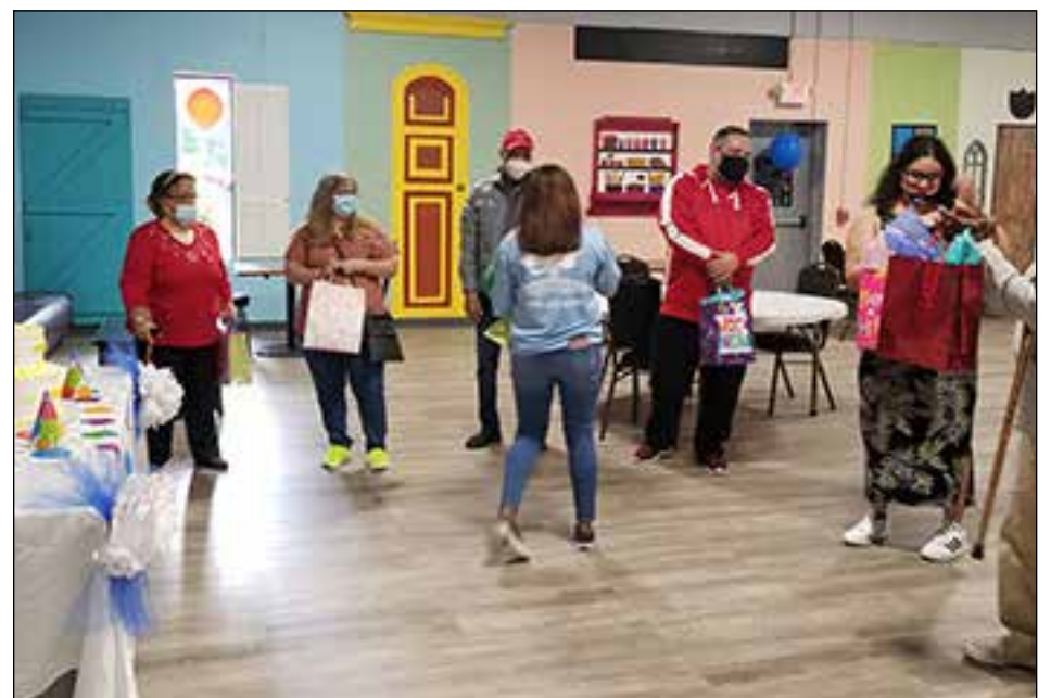
El último día de cada mes celebramos los cumpleaños de los participantes.