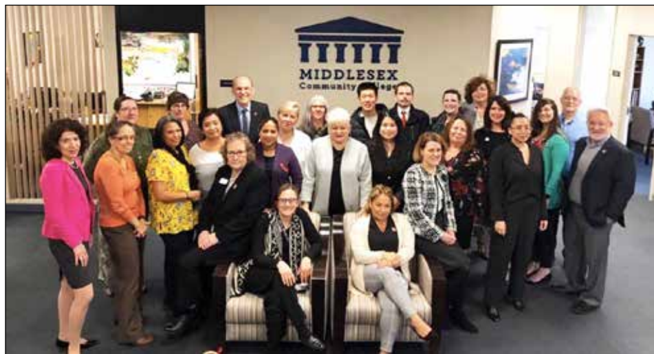
Middlesex Community College's free Alumni Association will host a free alumni-only webinar at 11 a.m. on Thursday, October 8. Two past MCC alumni events happened in-person before COVID-19.

Middlesex Community College is committed to preparing students for the future. For 50 years, Middlesex has helped over 26,000 alumni on their academic and professional paths. In collaboration with MCC's Career Development Office, the college's free Alumni Association will host a webinar for alumni, current students and faculty at 11 a.m. on Thursday, October 8.