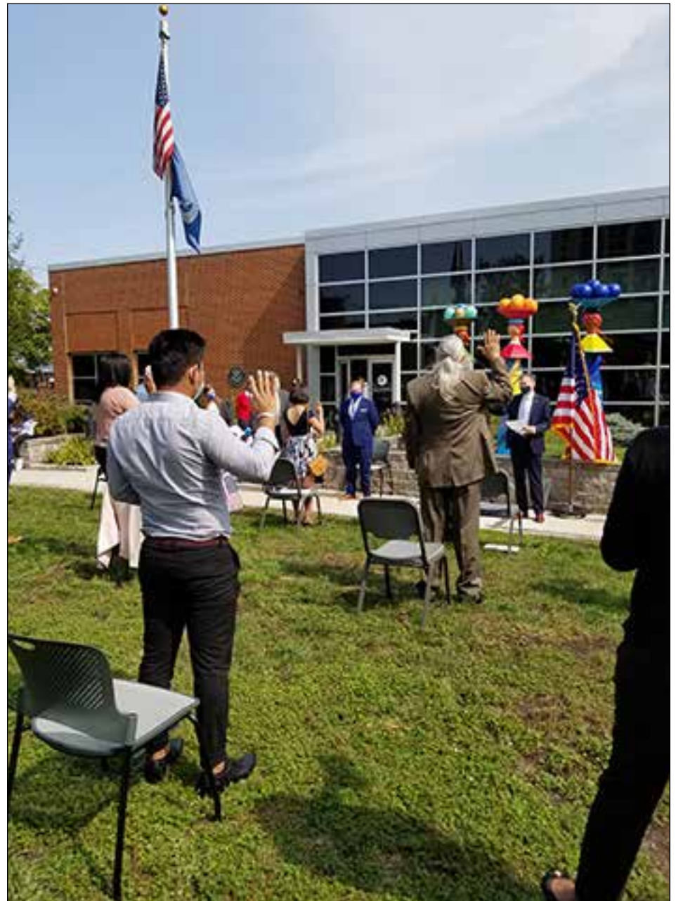
Photo taken during a ceremony outside of USCIS office on Sept. 17.