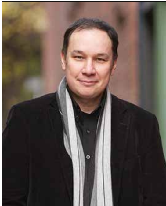
Jamie Ford, author of "Hotel on the Corner of Bitter and Sweet," will appear in a virtual library event on October 11 as part of the Nashua Reads: One City, One Book program.

The event is sponsored by the Friends of the Nashua Public Library and the Ella Anderson Trust.