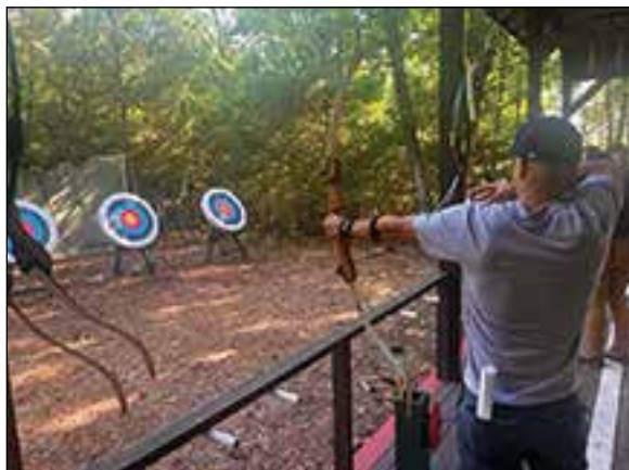
A Methuen Police Department Police Explorer takes part in an archery exercise at the Spirit of Adventure Law Enforcement Day.