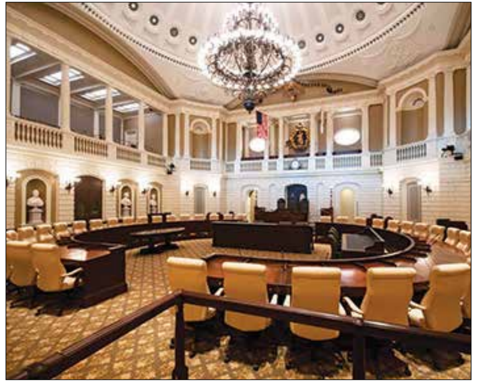
Massachusetts Senate.