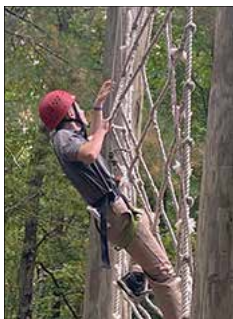
A Methuen Police Explorer climbs a rope ladder at the Spirit of Adventure Law Enforcement Day.