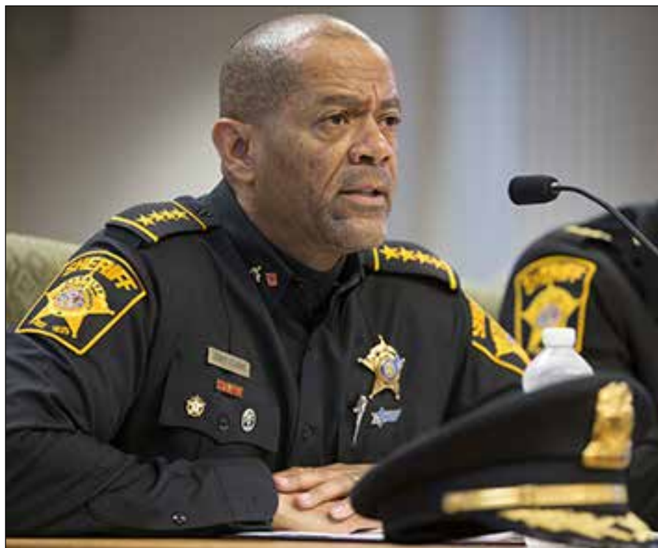
Wisconsin's Sheriff David Clarke.