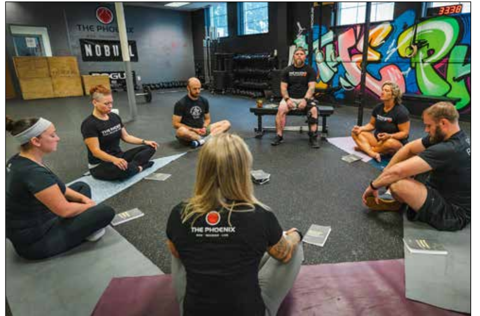
The Phoenix, a recipient of a recent GLCF grant, gather for Recovery Dharma Meditation With staff, volunteers, and team members from their Lowell chapter.