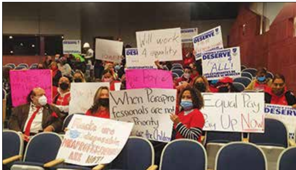
Este fue el grupo que hizo presencia ante la reunión de la Alianza para la Educación .