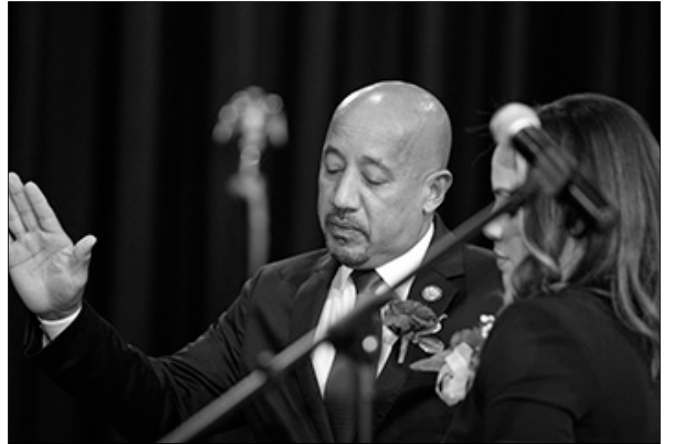
Tan pronto como terminó de tomar su juramento, prometió limpiar las calles y callejones, junto con otras cosas.