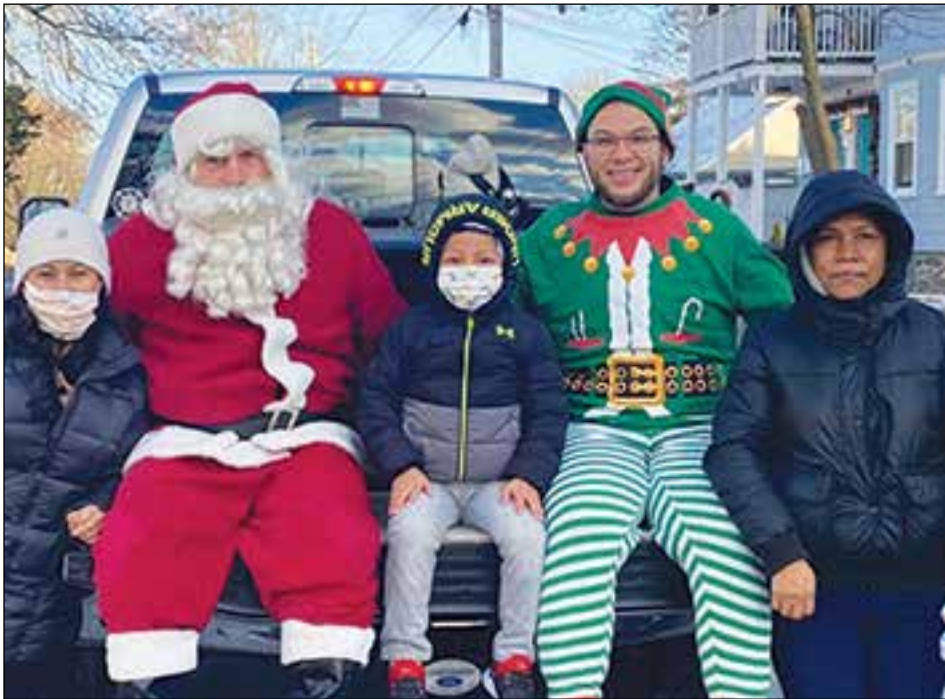
El domingo, 19 de diciembre, la Ciudad de Lawrence disfrutó de una parada Navideña con carrozas y cientos de familias celebrando la temporada. Vea más fotos en la página 7,

By Arianna, Seventh Grade, Esperanza Academy