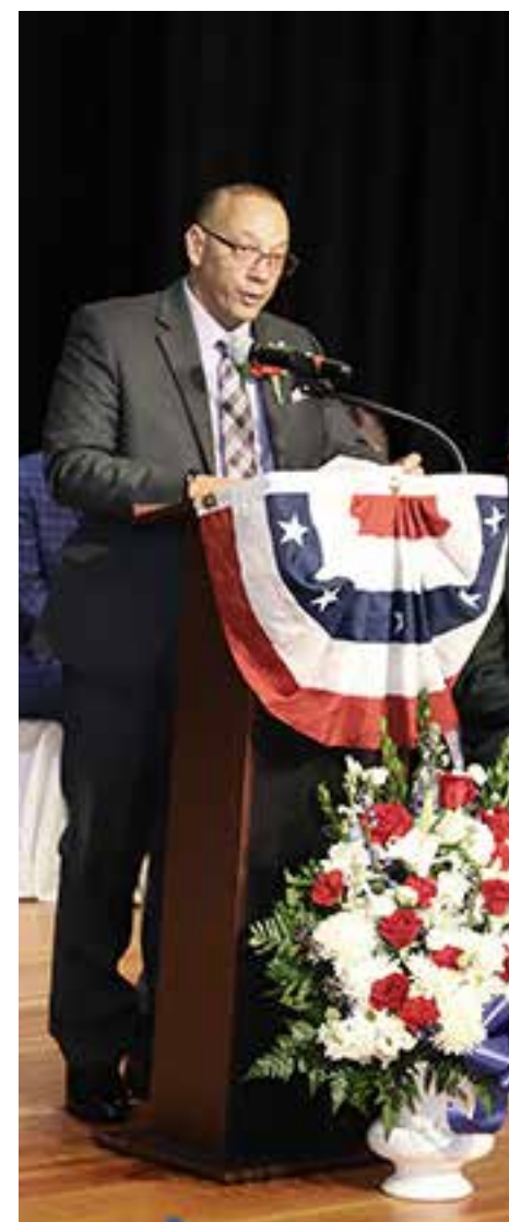
Representante Estatal Frank Morán