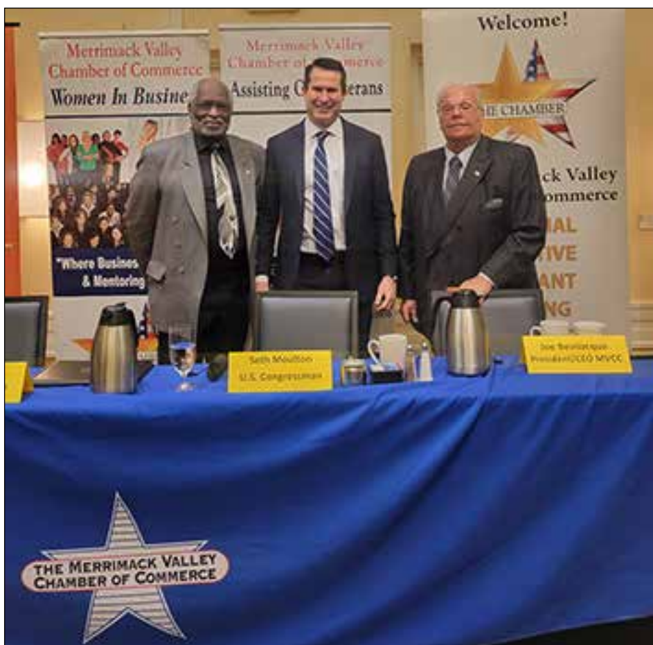
The Merrimack Valley Chamber hosted the Annual Congressional Forum with Congressman Seth Moulton at the DoubleTree in Andover. The Congressman discussed important issues that the Merrimack Valley and nation are facing today, answered questions and met with Chamber Members.