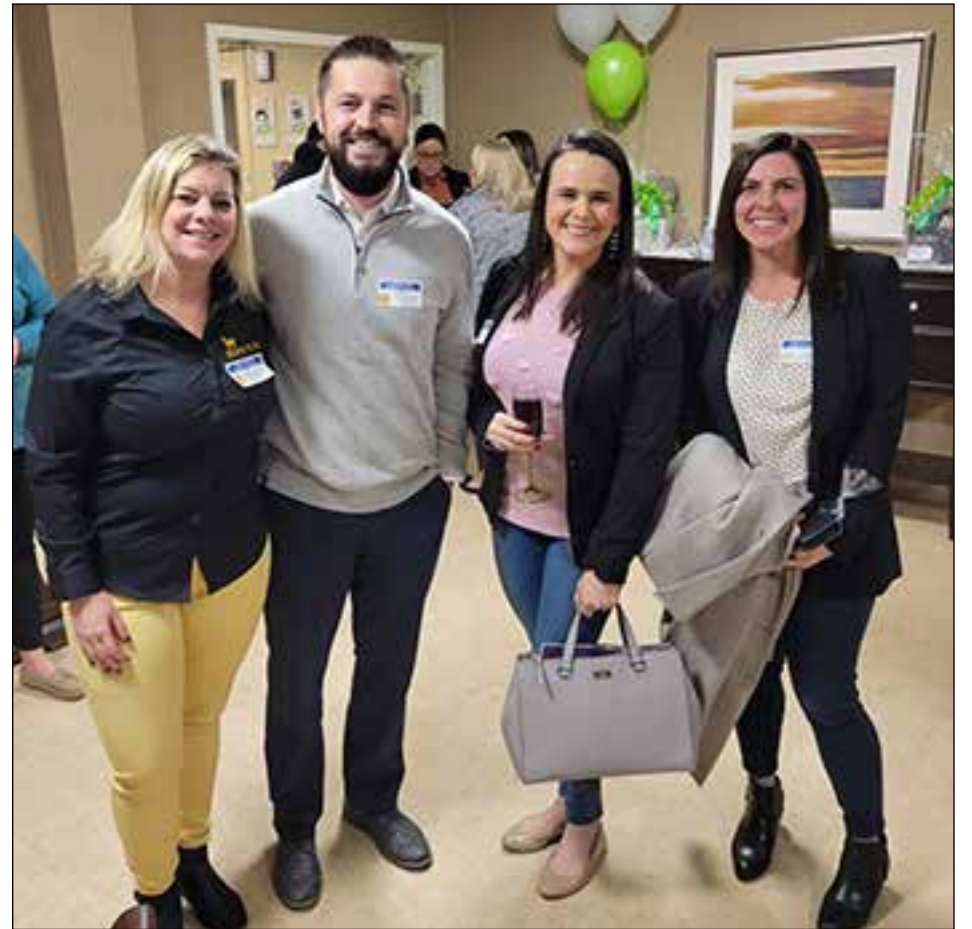
The Merrimack Valley Chamber Business Networking Mixer at Aspen Hill Healthcare and Rehab was amazing, thanks to this incredible crowd!