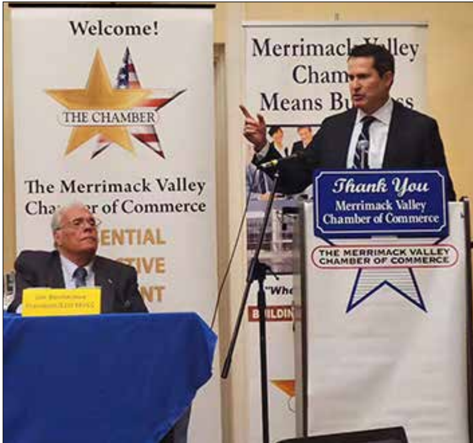
The Merrimack Valley Chamber hosted the Annual Congressional Forum with Congressman Seth Moulton at the DoubleTree in Andover. The Congressman discussed important issues that the Merrimack Valley and nation are facing today, answered questions and met with Chamber Members.