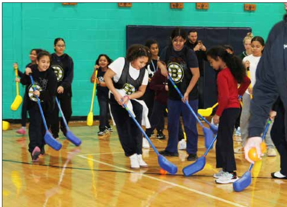
The Merrimack Valley YMCA takes pride in its commitment to inspiring and challenging the youth in our community.