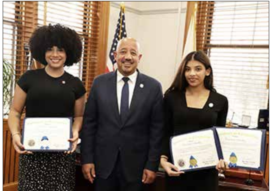
(Read more about them on page 6 // Vea más información sobre ellas en la página 6)