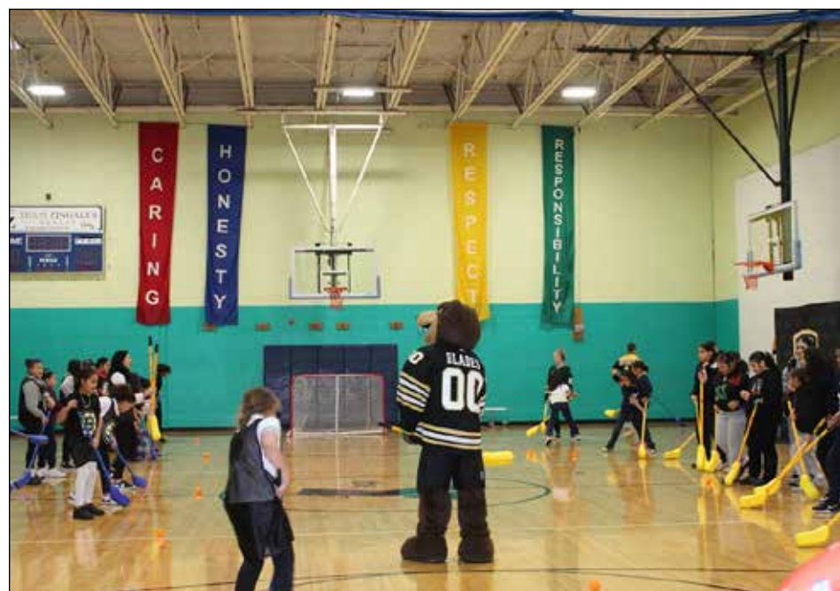
The Lawrence YMCA Girls play floor hockey alongside Bruin's legend, Blades.

"The test of success is not what you do when you are on top. Success is how high you bounce when you hit the bottom."