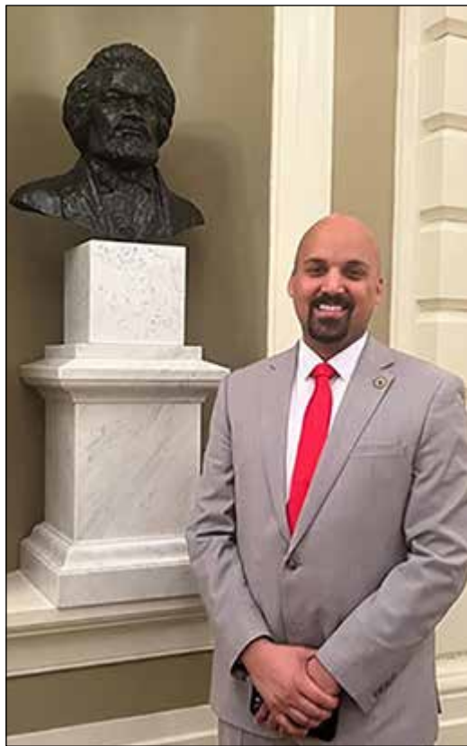
A historic moment as we unveiled Frederick Douglass's bust in the Senate, celebrating diversity and justice.

Su apoyo y comentarios son vitales para nosotros. Ya sea a través de legislación o iniciativas locales, nuestro objetivo