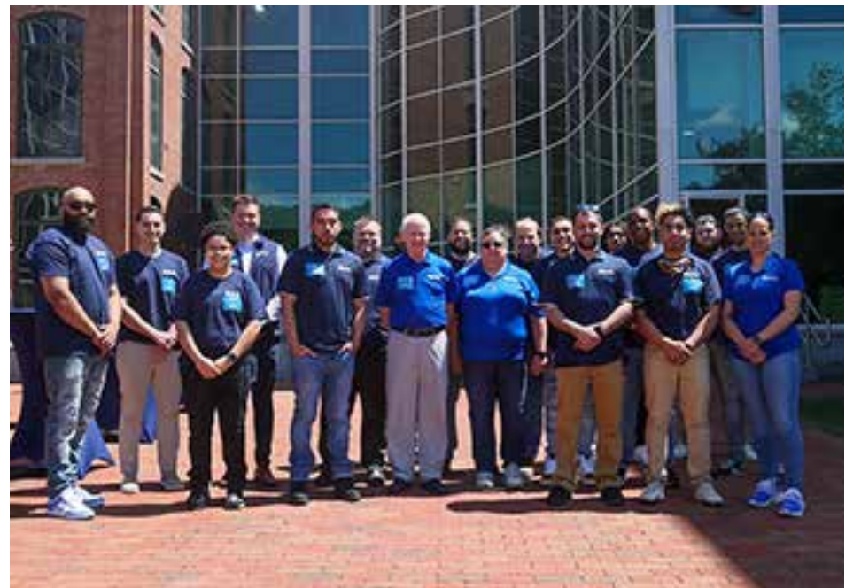
Local jobs, local assembly of worldwide product in Merrimack Valley.(See photos on page 3)