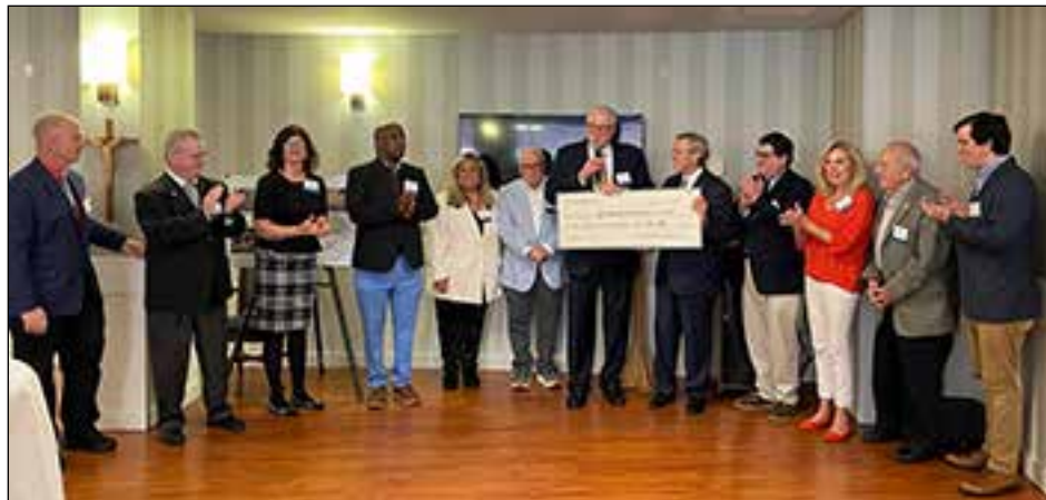
Mary Immaculate Guild Board of Directors:

Covenant Health is an innovative, Catholic regional healthcare system and