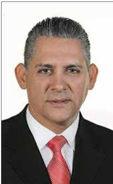
Por Tomás Núñez, ThD

El ser humano esta poseído por dos hambres: 1) la de pan que es saciable 2) la de belleza que es trascendencia y lo sagrado, que es insaciable. Es aquí en esta segunda hambre donde se sitúa la religión y todos los caminos espirituales. han surgido y siguen surgiendo a través de la historia para atender esta hambre insaciable. un frente avanzado de las ciencias de hoy es el estudio del cerebro y de su múltiples inteligencias. Los estudios destacan tres tipos de inteligencias: