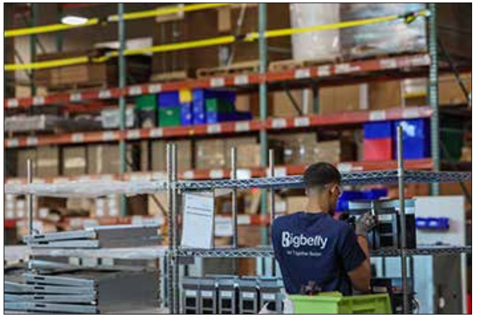
A Bigbelly team member at work.

"Talent wins games, but teamwork and intelligence win championships."