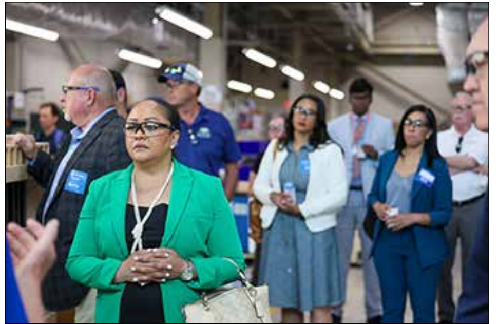
Rep. Estela Reyes was part of a group that toured the Bigbelly manufacturing facility.