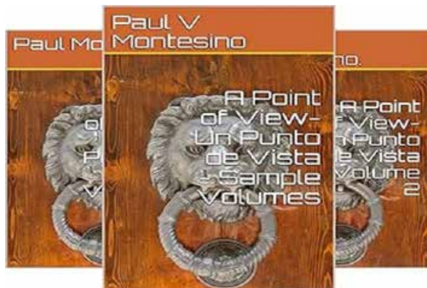
A Point of View-Un Punto de Vista: Volume Seven-Volumen Siete. (A Point of View-Un Punto de Vista Bilingual books) (Spanish Edition) Spanish Edition | Related to: A Point of View-Un Punto de Vista Bilingual books | by Dr. Paul Victor Montesino.