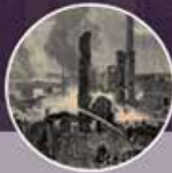
11:00 AM - 12:00 PM White Fund Lecture "No Avenging Gibbett": The 1860 Pemberton Mill Collapse"