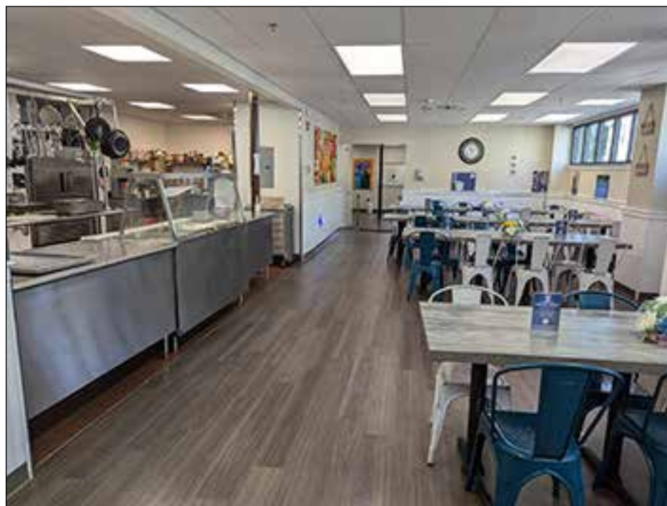
This modern kitchen and dining room are open from 9 AM to 2 PM daily, serving more than 1,300 residents