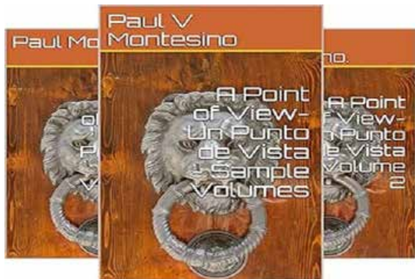
A Point of View-Un Punto de Vista: Volume Seven-Volumen Siete. (A Point of View-Un Punto de Vista Bilingual books) (Spanish Edition) Spanish Edition | Related to: A Point of View-Un Punto de Vista Bilingual books | by Dr. Paul Victor Montesino.