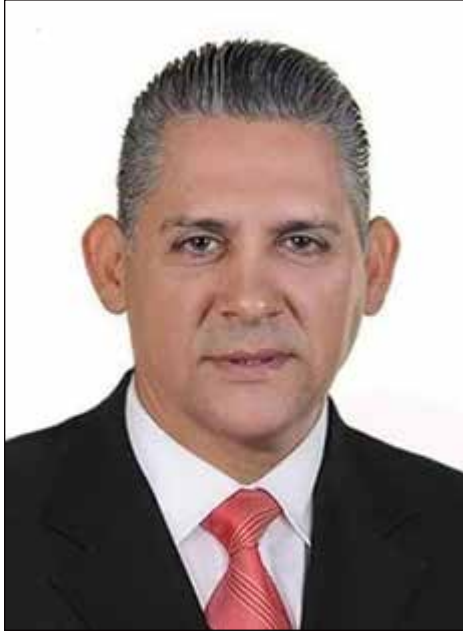
Por Dr. Tomás Núñez

El principio de la comunicación entre los seres humanos debió empezar desde el momento mismo de su aparición sobre la tierra, ya que cualquier cosa o necesidad personal, tendría de alguna manera que expresarse, simplemente el sentir hambre o sed, quizás por medio de señas con las manos, brincos y saltos para manifestar alegría, expresiones gestuales para indicar dolor, peligro, susto o disgusto.