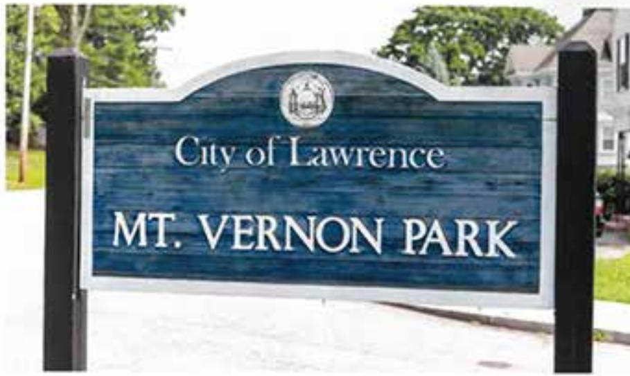
Mount Vernon is in South Lawrence.

(Este artículo fue publicado en la revista Northshore Magazine en la edición de setiembre, 2024.)