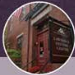
10:00 AM - 10:45 AM Annual Business Meeting & Updates