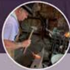
9:30 AM - 1:30 PM Blacksmithing at the Essex Company Forge

10:00 AM--10:45 AM Annual Business Meeting & Updates [Business Meeting Materials will be posted soon]