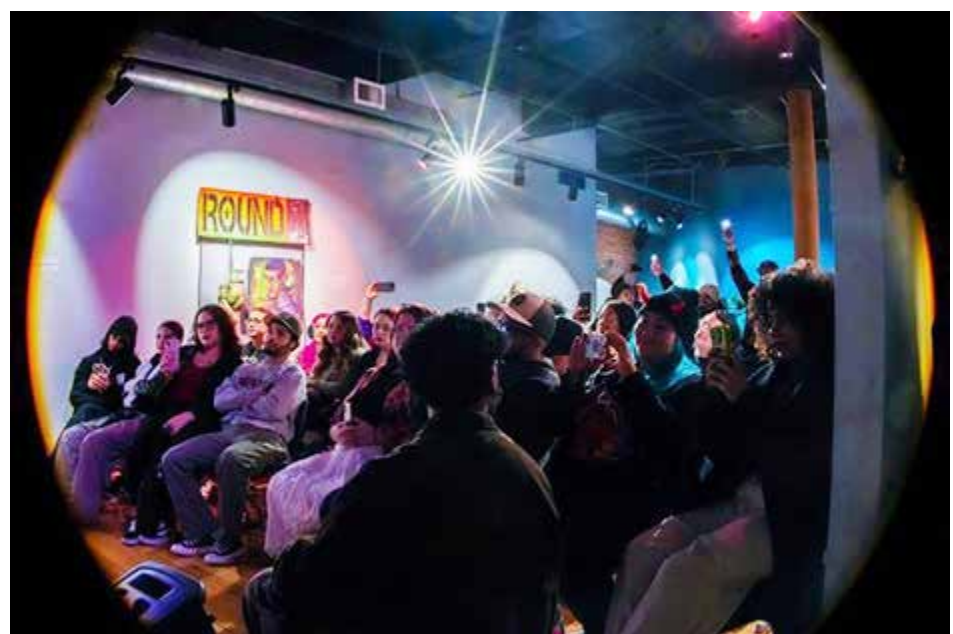
The musicians played for a packed house.

“¿Qué dulzura queda en la vida, si le quitas la amistad? Robar la vida a la amistad es como robarle al mundo el sol. Un verdadero amigo es más digno de estima que un pariente”.