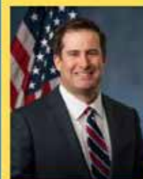
Congressman Seth Moulton