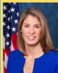
Congresswoman Lori Trahan

The Challenges & Opportunities Facing the United States in 2025.